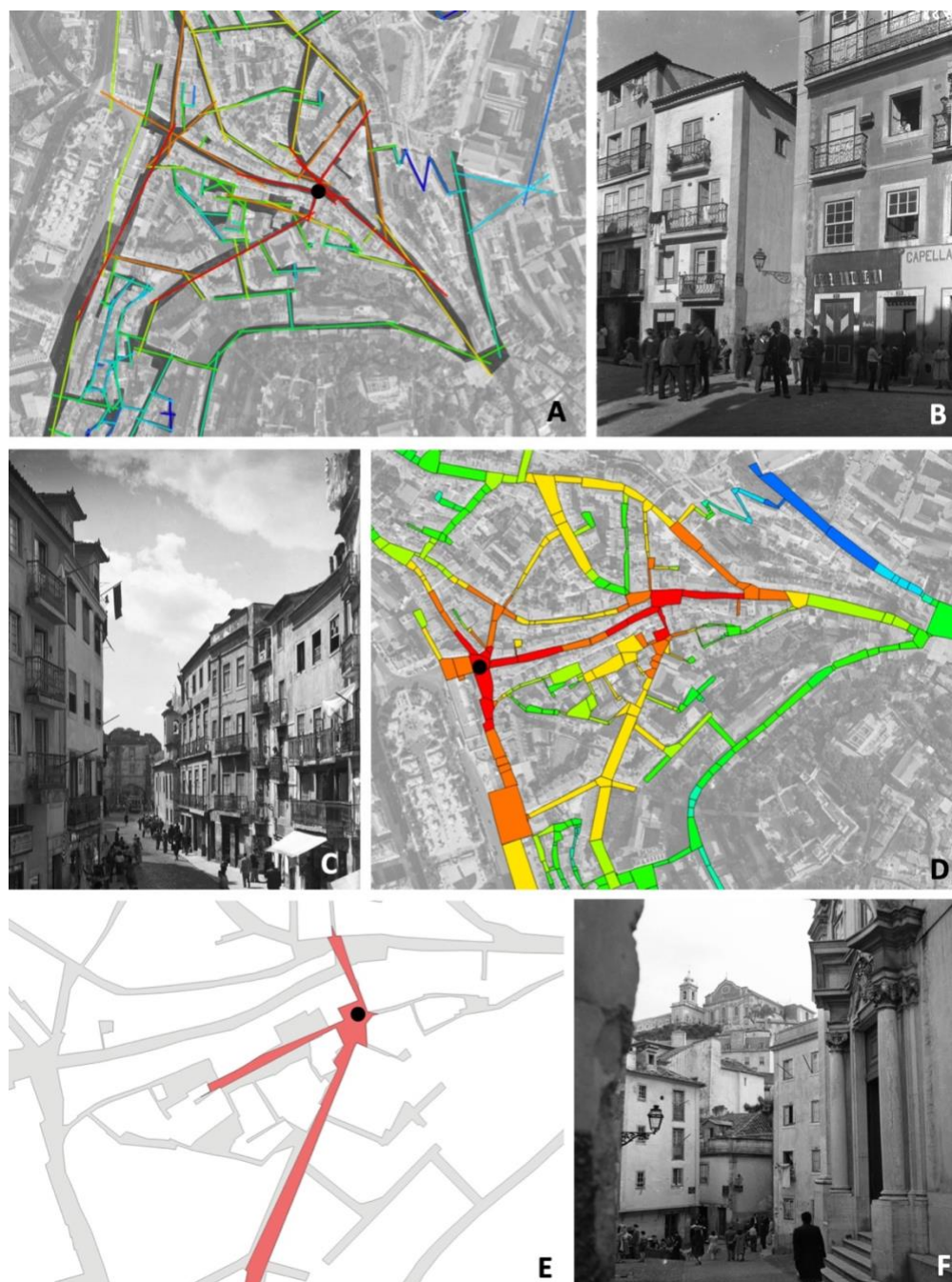
Figura 3: Conteúdo social e espacial do espaço urbano na Bairro da Mouraria em Lisboa: A - Mapa Axial de Integração; B - Largo do Terreirinho (Machado & Souza, 1900, AFCML); C - Rua da Mouraria (Eduardo

A Mouraria apresenta uma dupla estrutura funcional, local e urbana. A estrutura local encontrava-se tradicionalmente no comércio de subsistência dirigido aos operários das fábricas, inseridas na estrutura habitacional do bairro. A estrutura urbana encontra-se na multitude de cafés, lojas e atividades lúdicas dirigidas também à restante população da cidade.