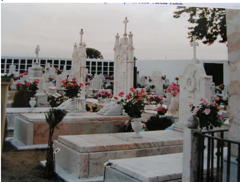
Cemitério de Benavila: as campas da família Abreu Callado, na avenida principal, junto à capela, mas revelando a sobriedade que os caracterizou em vida (não gastaram dinheiro num jazigo).